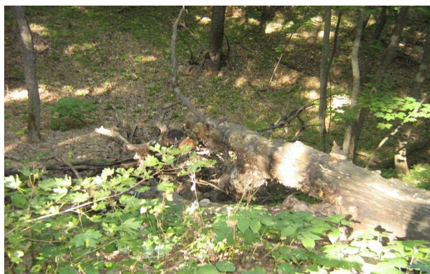
The fallen oak